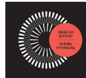
2015 Danses Futuristes Studio de Meudon Autoproduction